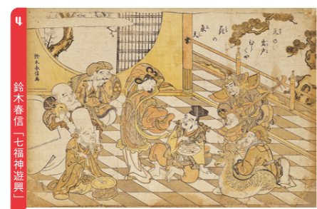
鈴木春信「七福神遊興」 4