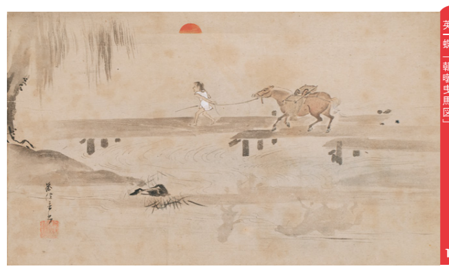
英一蝶「朝暁曳馬図」 1