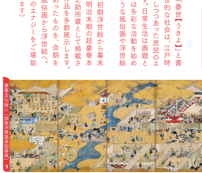
重要文化財!! 四家河原遊楽図屏風 3 1 Leading a Horse under the Morning Sun by Hanabusa Itcho 2 Courtesan with Child Attendants beneath Cherry Blossoms by Katsushika Hokusai 3 Important Cultural Property Scenes along the Riverside at Shijo, Kyoto 4 Seven Gods of Good Fortune Amusing Themselves by Suzuki Harunobu 5 Parody of Tugen (Zhang Guolao) by Nishikawa Sukenobu 6 Parody of Kurumabiki; Four Beauties Enacting the Oxcart Scene by Kitagawa Utamaro 7 The Actor Ichikawa Danjuro V in a Shibaraku Performance by Katsukawa Shunko