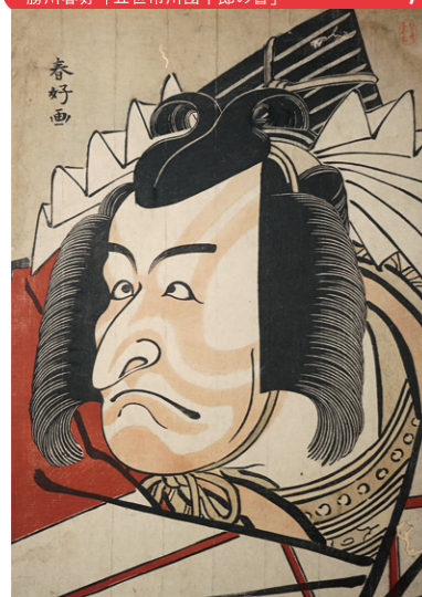
勝川春好「五世市川團十郎の暫」 7