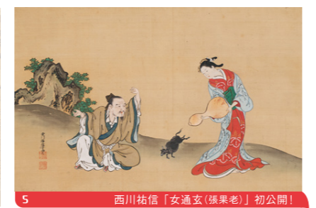
西川祐信「女通玄(張果老)」初公開! 5