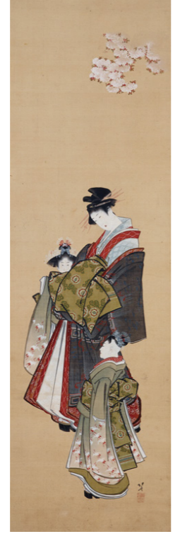
葛飾北斎「桜下美人図」 2