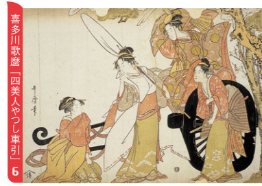
喜多川歌麿「四美人やしり車引」 6