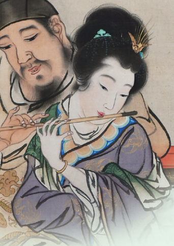
渡辺南岳「玄宗楊貴妃一笛双弄図」(部分) Watanabe Nangaku, (with an inscription by Kameda Hōsai) Yang Guifei and Emperor Xuanzong playing flute together