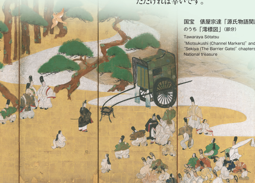
国宝 俵屋宗達「源氏物語関屋濤標図屏風」 のうち「濤標図」(部分) Tawaraya Sōtatsu "Miotsukushi (Channel Markers)" and "Sekiya (The Barrier Gate)" chapters from the Tale of Genji National treasure