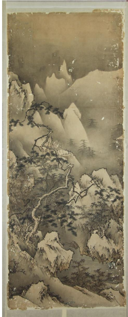
「四季山水図屏風」(部分)